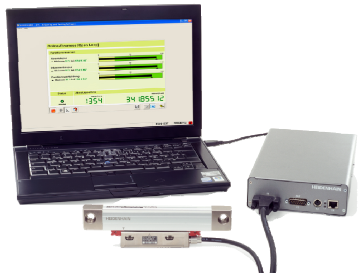
Anwendungsbeispiel ATS-Software und PWM 20